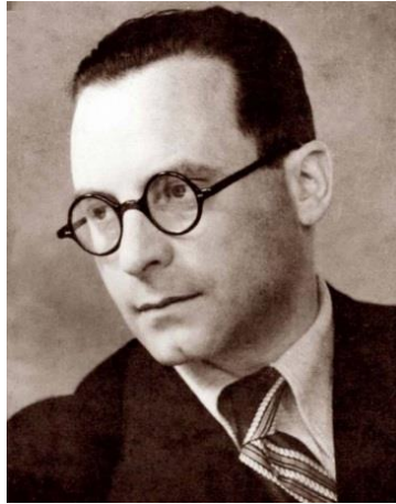
SZERB ANTAL (1901-1945)

1. Nemzedékek óta nagyon művelt értelmiségi család leszármazottja. A családi indíttatás meghatározó szerepet játszott műveltsége megszerzésében. A budapesti piarista gimnáziumban egy költő volt a magyar tanára, aki támogatta irodalmi ambícióit. Itt írta élete első verseit, novelláit, sőt felsős gimnazista korában megjelentek esszé- és drámakísérletei is.